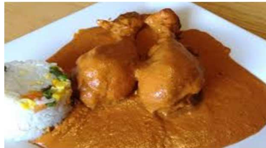
poulet avec sauce aux arachides