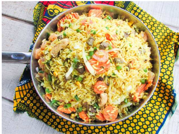
Nigerian fried rice