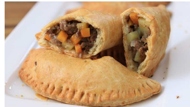
Nigerian meat pies