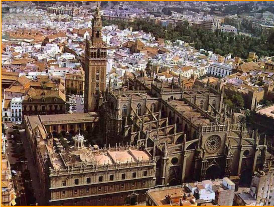
VISTAS DE LA CATEDRAL DE SEVILLA